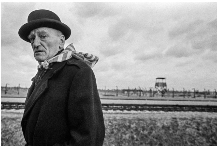
80. výročí deportací Židů z českých zemí připomene i výstava fotografií Pavla Diase

Památník Terezín, Židovské muzeum v Praze, Památník ticha, Terezínská iniciativa a dalších osm paměťových institucí se spojí, aby připomněly i prostřednictvím společného programu letošní