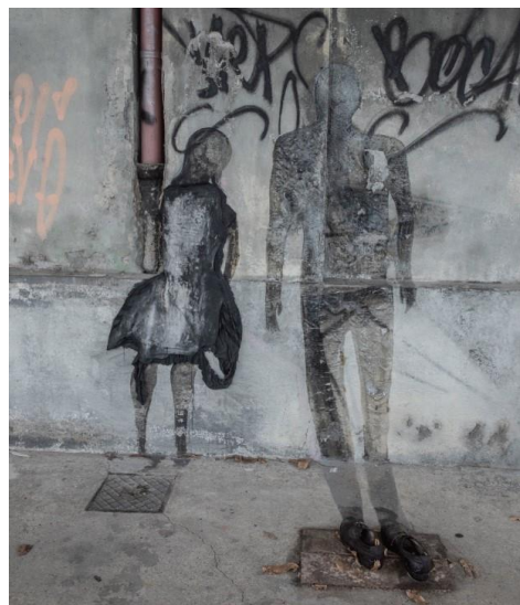
Srdečně Vás zveme na reverbisáž podzimních výstav Památníku ticha