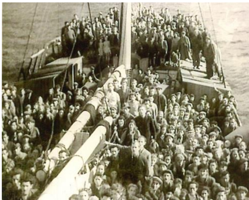
Ilustrativní snímek z filmu Příběh trosečníků Patrie