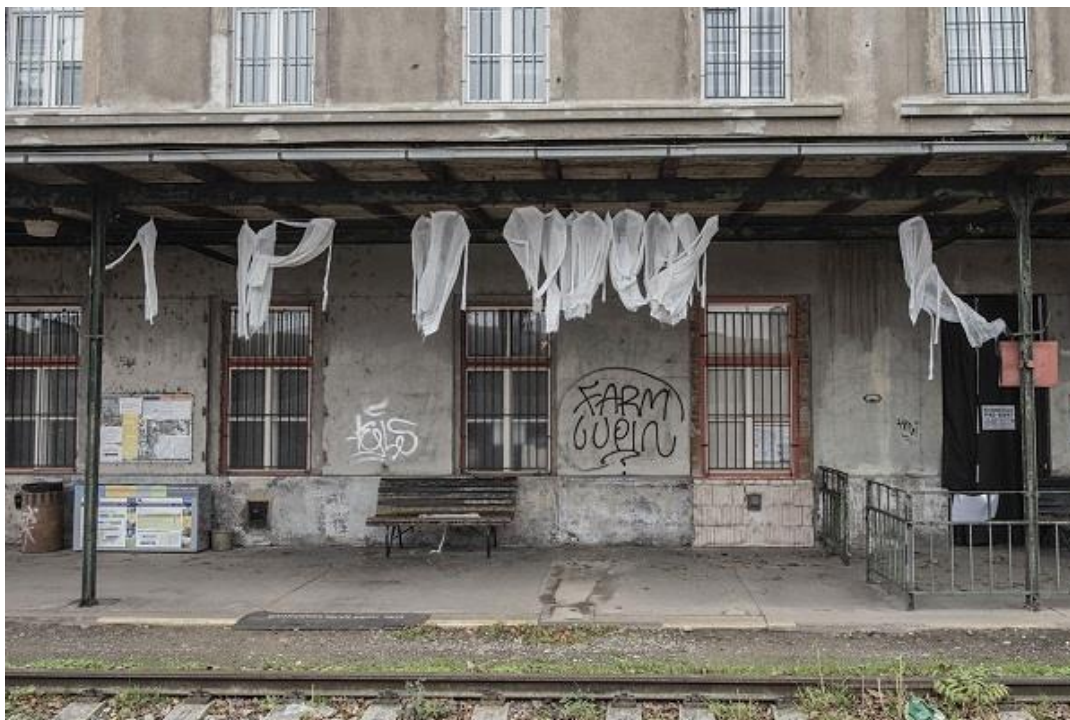
Vrstvy paměti města – Pomíjivost na perónu nádraží Bubny

Součástí programu je i procházková přednáška s architektem Zdeňkem Lukešem po stopách německých a židovských architektů pražských Holešovic