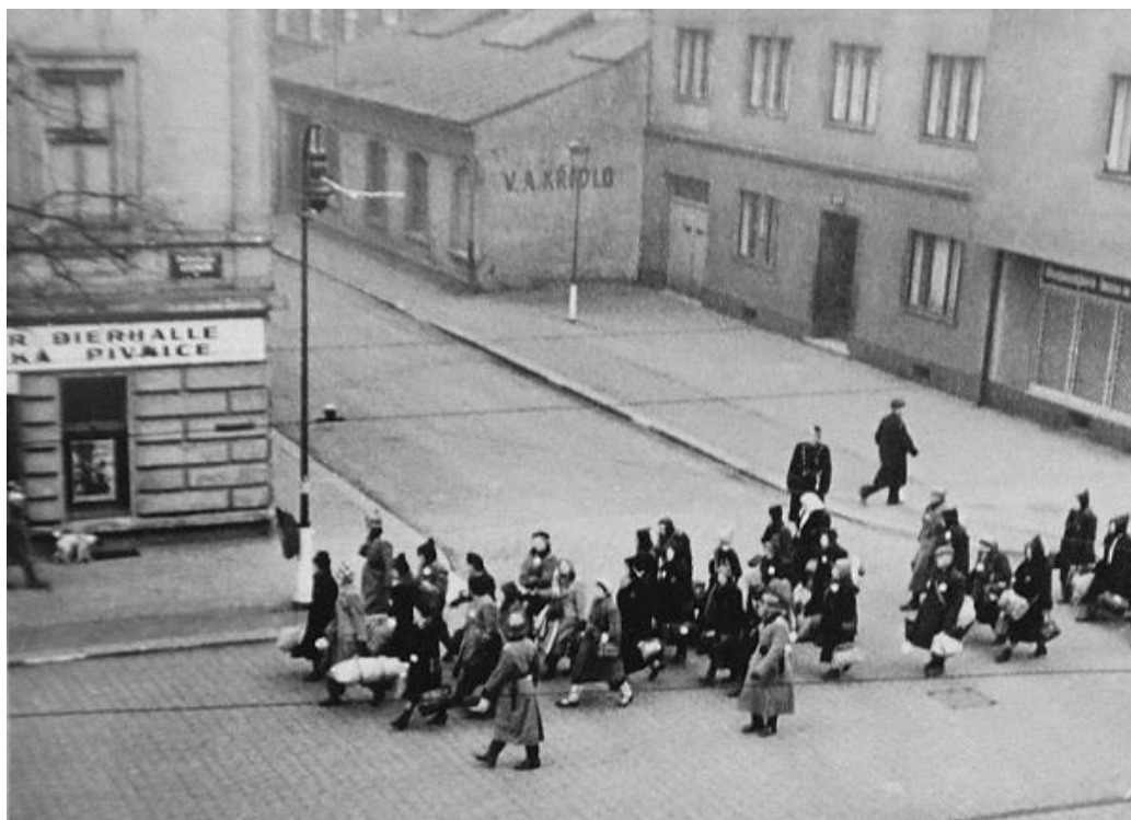
židovský transport míjející roh ulic